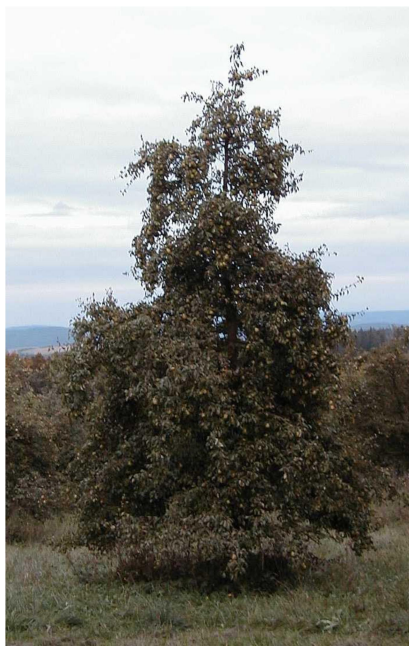
Dospělý jedinec a plod hrušně domácí Pyrus communis 'Dielovo'