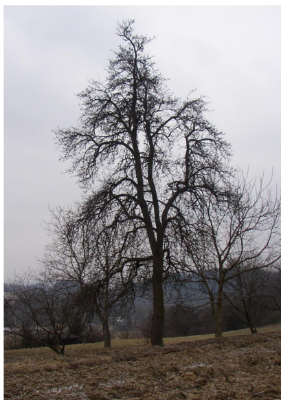
Dospělý jedinec a plod hrušně domácí Pyrus communis 'Salisburyho'

Jedná se o odrůdu hrušně s bujným a vzpřímeným růstem. Koruna je vysoce jehlancovitá s převislými větvemi, vhodná i k silnicím. Plody dozrávají v září – říjnu, dužnina je bílá, jemná, chuť sladce kořenitá.