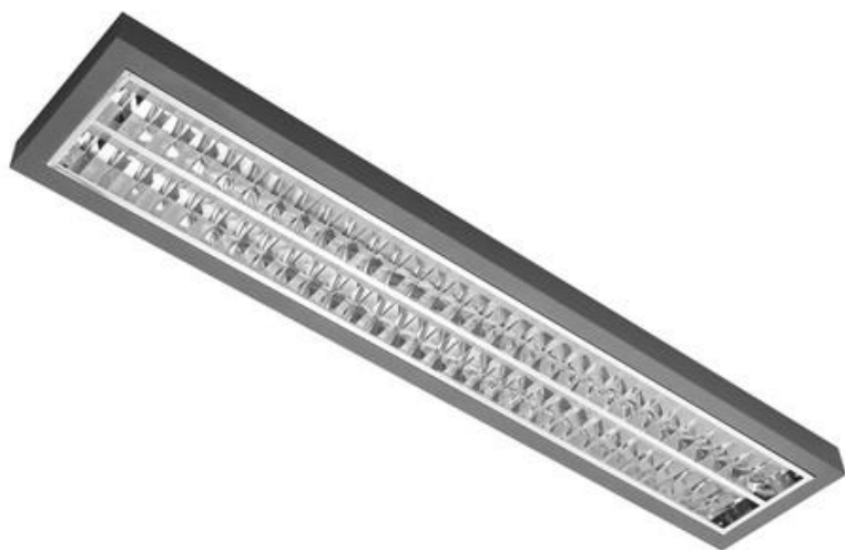
C1 - LED SVÍTIDLO 26W, PŘESAZENÉ, PRIZMA, IP20