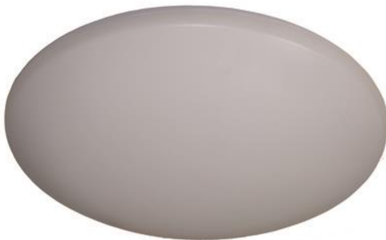
N1 - NOUZ. LED SVÍTIDLO 3W, S PIKTOGRAMEM, JEDNOSTRANNÉ, IP65, PŘISAZENÉ, BATERIE 1HOD