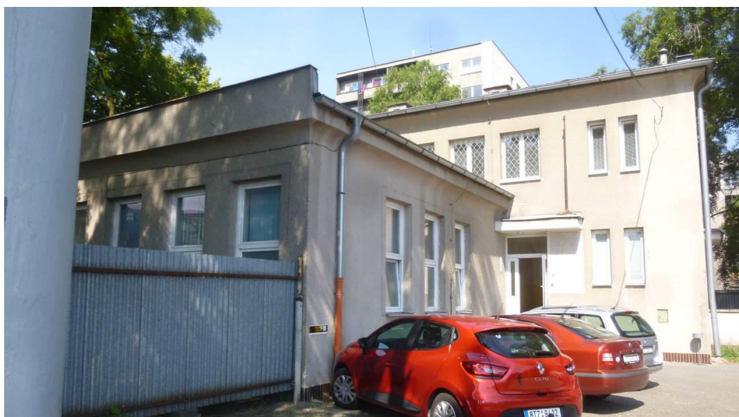
Foto č. 3 Dopravní podnik Ostrava a.s., - objekt č. 3