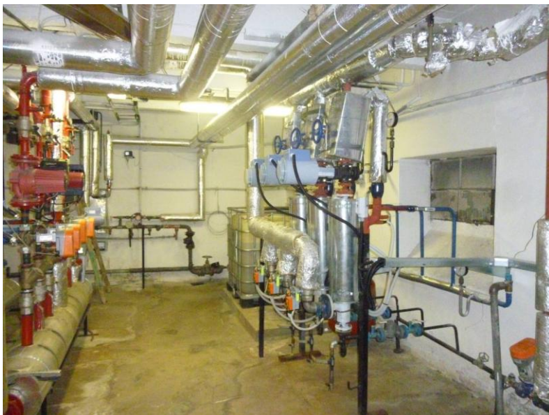
Foto č. 6 Dopravní podnik Ostrava a.s., - výměníky v PS1