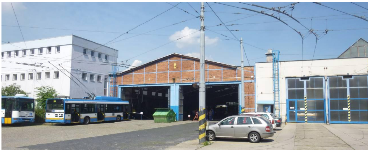
Foto č. 4 Dopravní podnik Ostrava a.s., - objekt č. 4