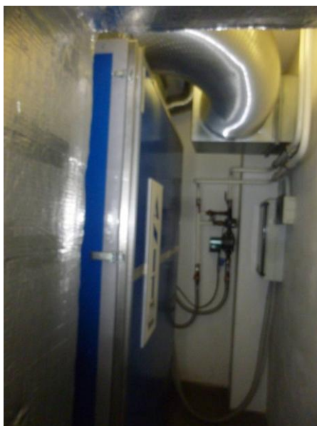
Foto č. 9 VZT jednotka

V areálu se nachází několik lokálních klimatizačních jednotek, jejichž provoz je v rámci areálu zanedbatelný.