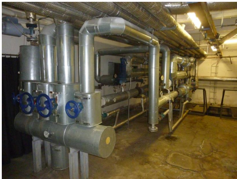
Foto č. 5 Dopravní podnik Ostrava a.s., - výměníková stanice PS1

Haly č. 1 až 4 jsou vytápěny teplovodním potrubním systémem. Ostatní posuzované objekty jsou vytápěny teplovodní soustavou s článkovými radiátory.