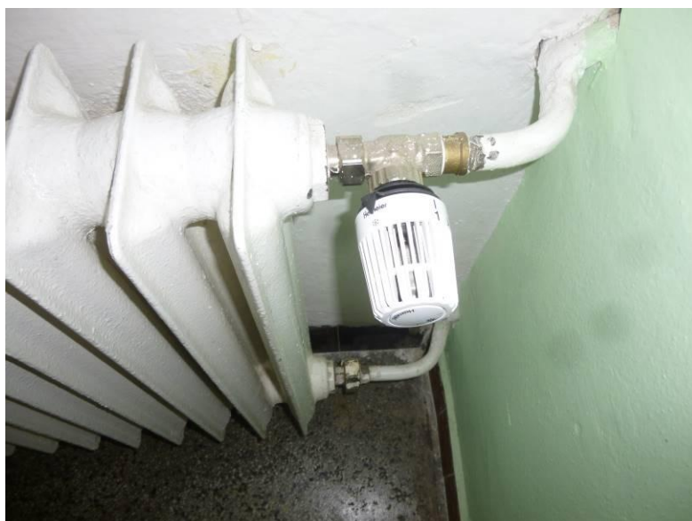
Foto č. 8 Radiátor s TRV hlavicí v objektu č. 1