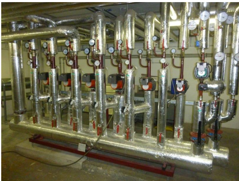
Foto č. 6 Dopravní podnik Ostrava a.s., - výměňková stanice PS2