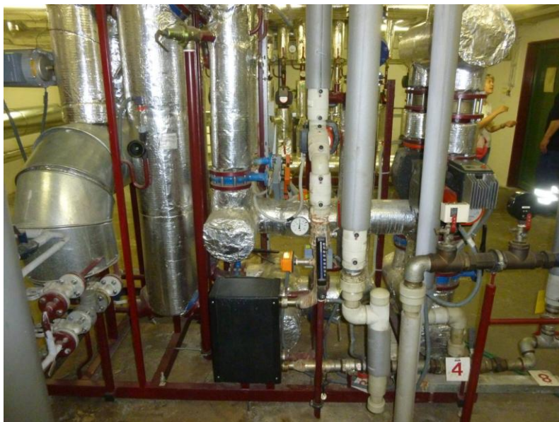
Foto č. 7 Dopravní podnik Ostrava a.s., - výměník v PS2