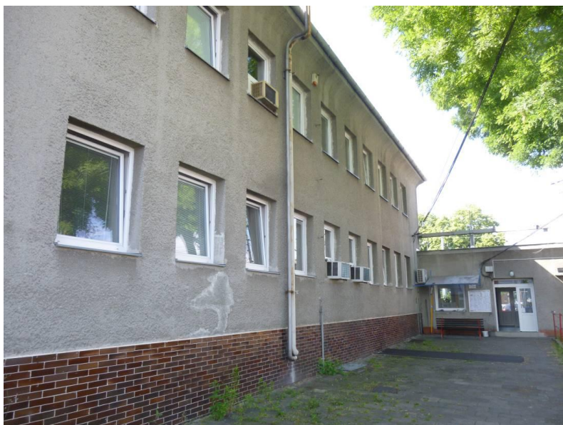
Foto č. 1 Dopravní podnik Ostrava a.s. - objekt č. 1