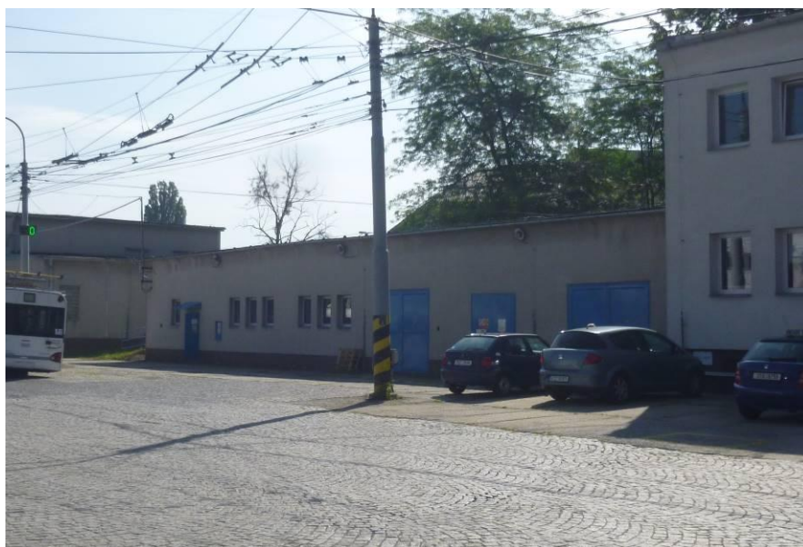
Foto č. 2 Dopravní podnik Ostrava a.s., - objekt č. 2