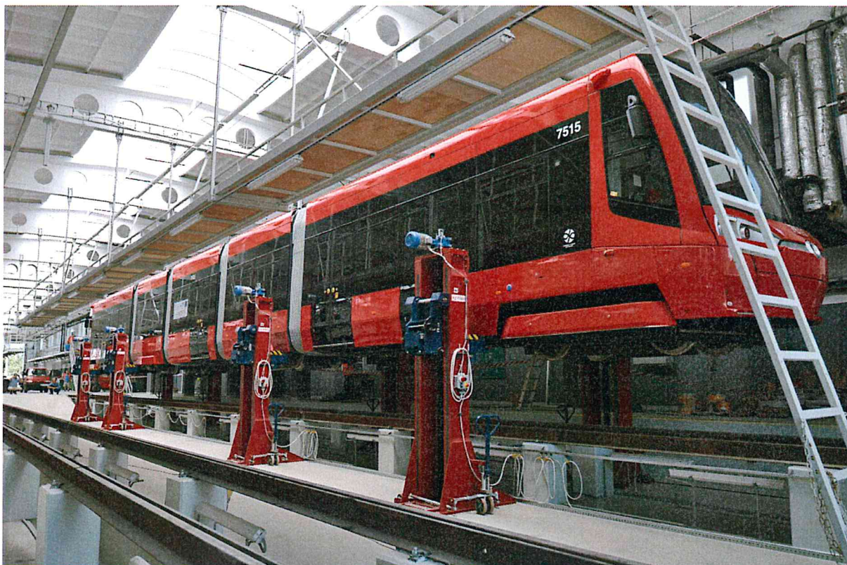
Obr. č. 1 Příloha k žádosti dodavatele o vysvětlení zadávací dokumentace č. 3