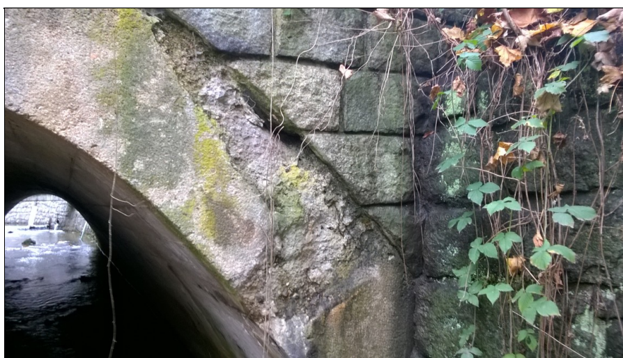
Rozpad boční plochy NK na výtoku