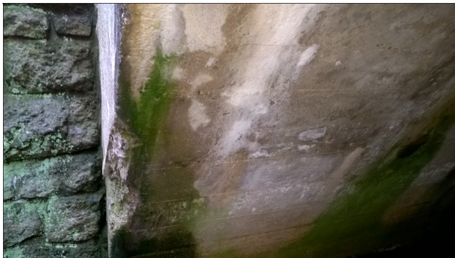
Projevy zatékání na výtakovém okraji objektu