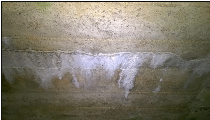
Horizontální trhlina v pohledu NK s inkrustací