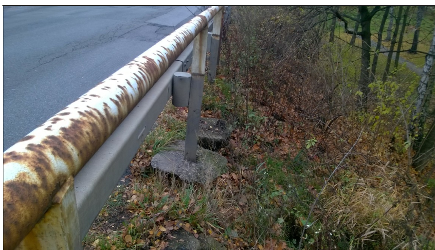
Poruchy uchycení svodidlových sloupků na vtoku