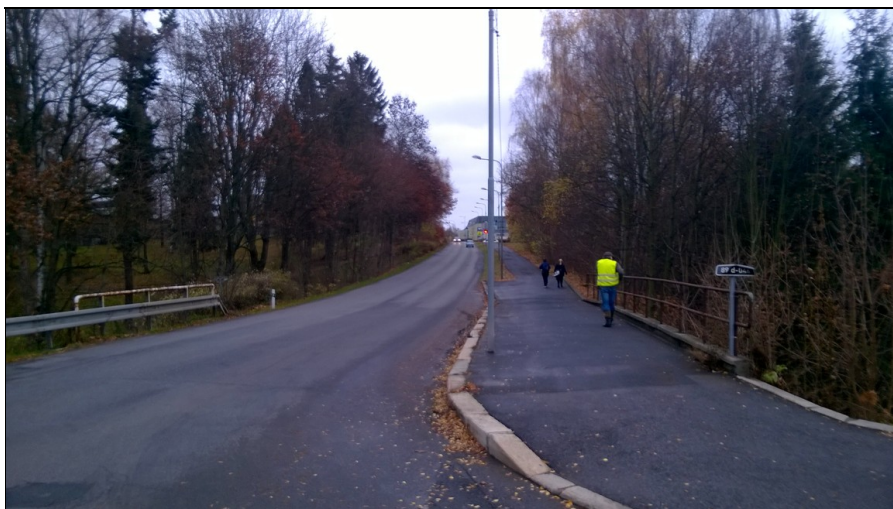
Uspořádání na mostě