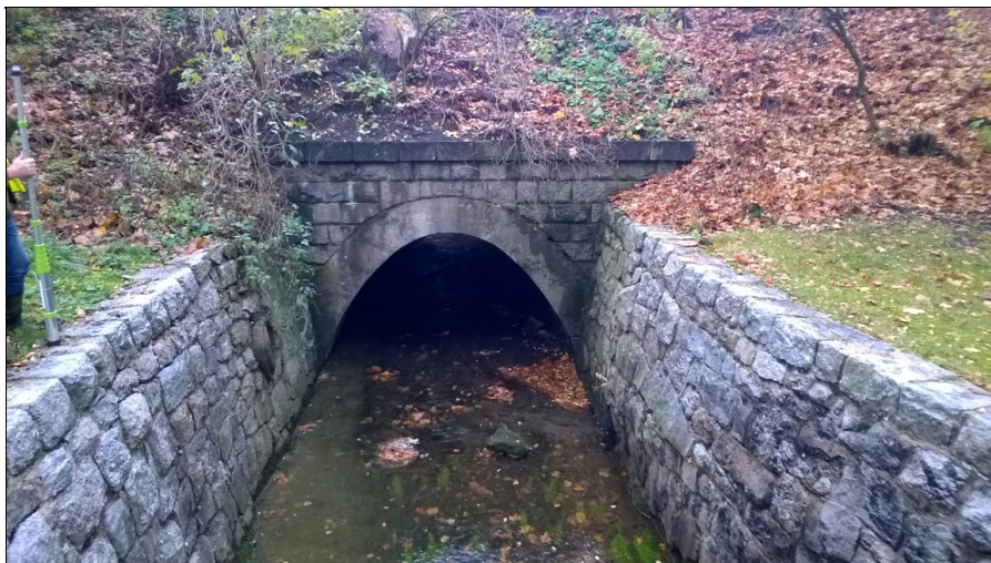
Pohled na vtokovou stranu objektu