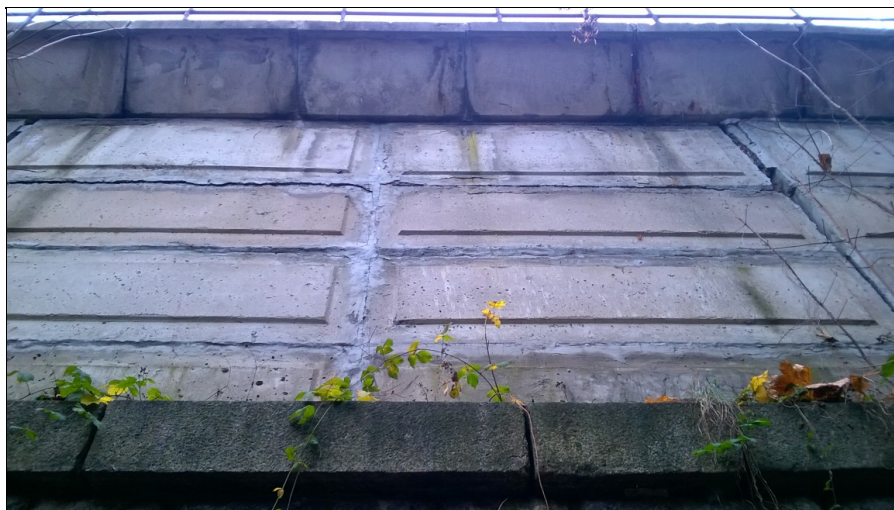
Prefabrikovaná část čelní zdi na výtoku