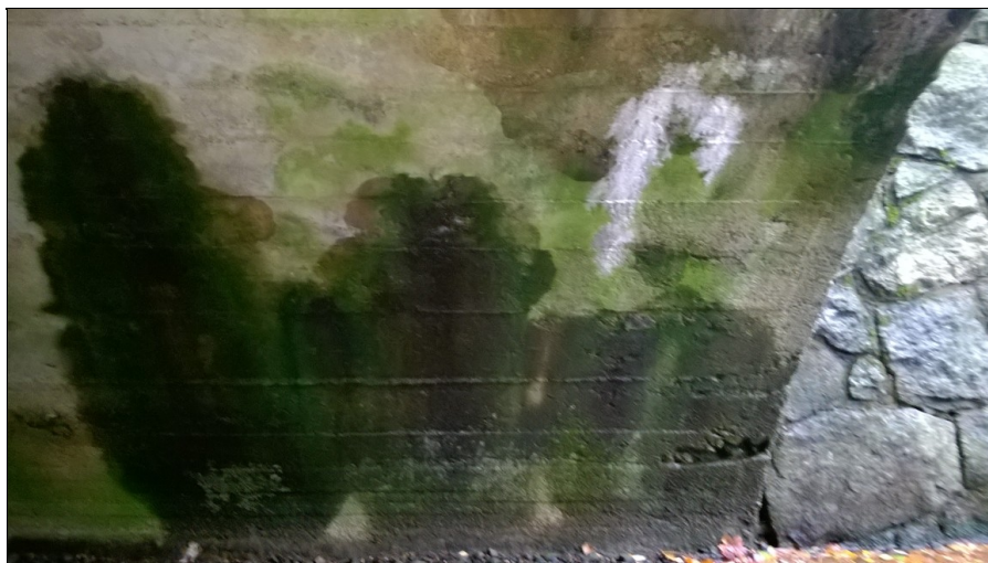
Průsaky ve vtokové oblasti