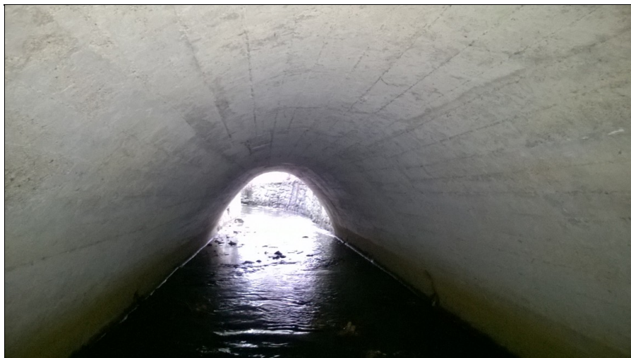
Pohled do mostního otvoru