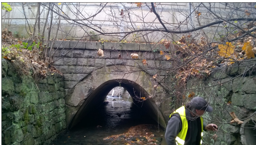
Pohled na výtokovou stranu objektu