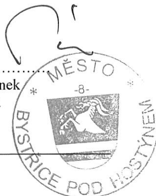
Mgr. Zdeněk Pánek starosta města