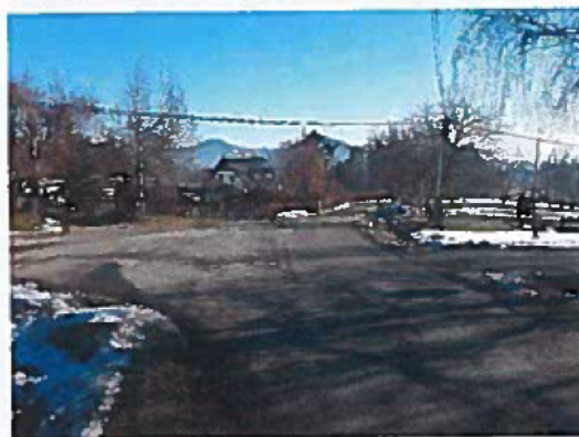
Silnice III/26211 Kamenický Šenov - Slunečná, rekonstrukce silnice