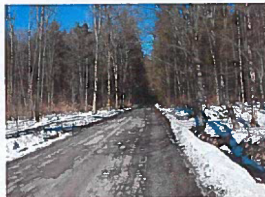
Silnice III/26211 Kamenický Šenov - Slunečná, rekonstrukce silnice