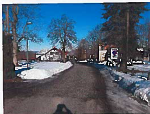
Silnice III/26211 Kamenický Šenov - Slunečná, rekonstrukce silnice