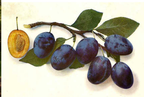
Mladý jedinec a plod švestky domácí 'Dolanka'