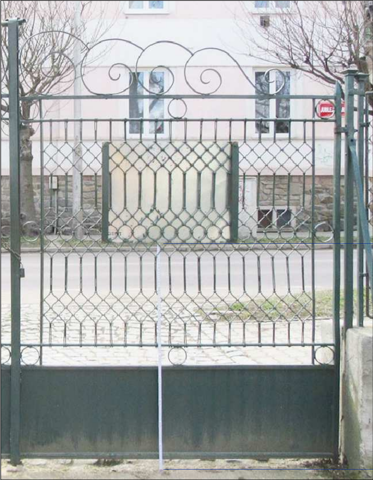
FOTOPOHLED NA VSTUPNÍ BRÁNU MEZI REKREAČNÍM TRÁVNÍKEM A KVĚTNICÍ M 1:20 POHLED Z PARKU. BRÁNA JE VZOREM PRO NOVOU BRÁNU DO BOTANICKÉ ZAHRADY. ROZMĚR KŘÍDLA 1,5m x 2,0m.