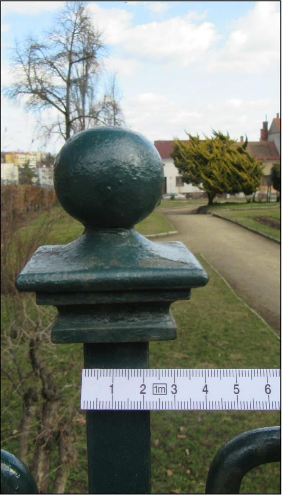
FOTOPOHLED A POHLED V M 1 : 1 NA KRYCÍ HLAVICI SLOUPKU BRÁNY A SLOUPKU OPLOCENÍ. SLOUPEK BRÁNY MÁ PROFIL 24 / 24mm, SLOUPEK OPLOCENÍ 20 / 20mm.