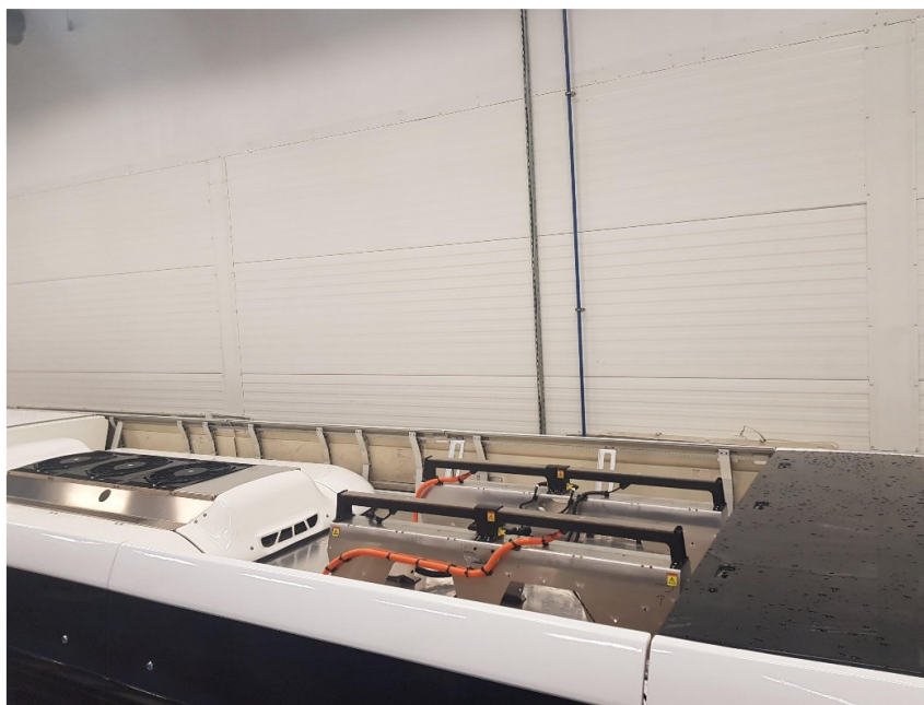
Obrázek k požadavku 4.2

Požadavek 4.2: Je možno akceptovat lakování pouze části střechy autobusu? Střední část střechy autobusu je potažena Aluminiovým plechem, který má na sobě vytvořenu antikoroziní oxidační vrstvu. Viz obr. níže.