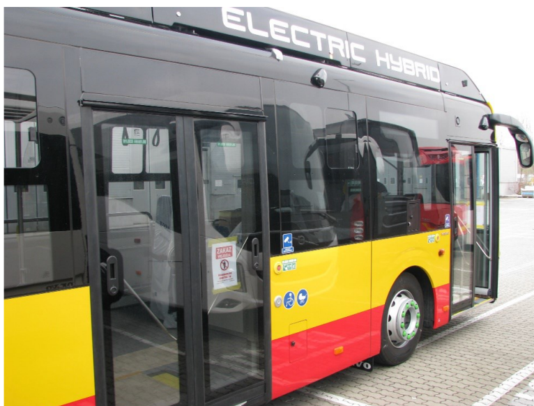
Výkres a obrázek k požadavku 4.5