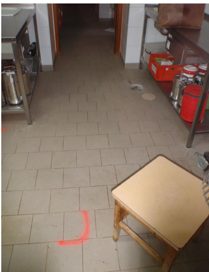
PODLAHOVÁ KONSTRUKCE KUCHYNĚ ( VARNY ) – TRASA KANALIZACE