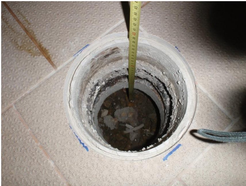
PROSEDNUTÍ PODLAHY – SONDA V PODLAHOVÉ KONSTRUKCI