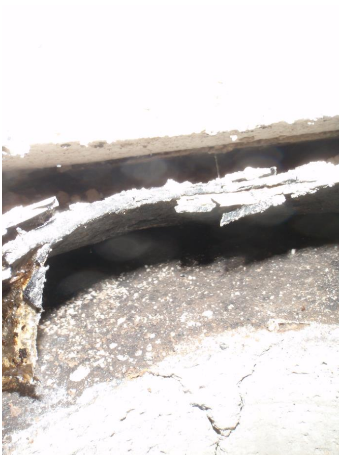
PROSEDNUTÍ PODLAHY – KAVERNA POD PODLAHOU