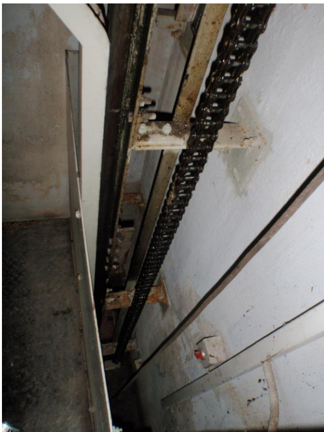
VNITŘNÍ OCELOVÁ NOSNÁ KONSTRUKCE