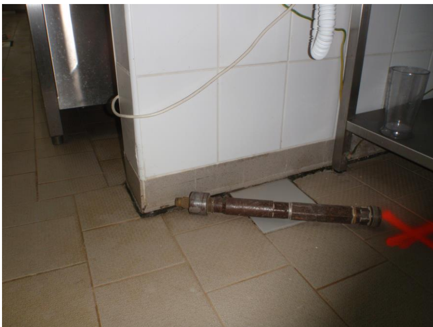
PROSEDLÁ PODLAHA – UTRHLÉ KERAMICKÉ SOKLÍKY