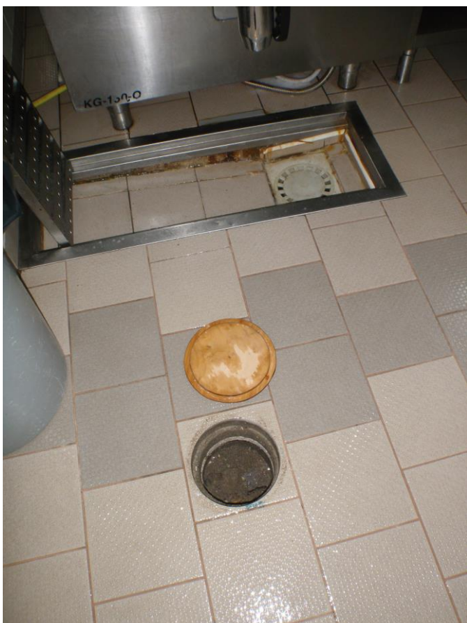
POKLESLÉ PODLAHOVÉ VPUSTI V KUCHYNI SONDA V PODLAHOVÉ KONSTRUKCI