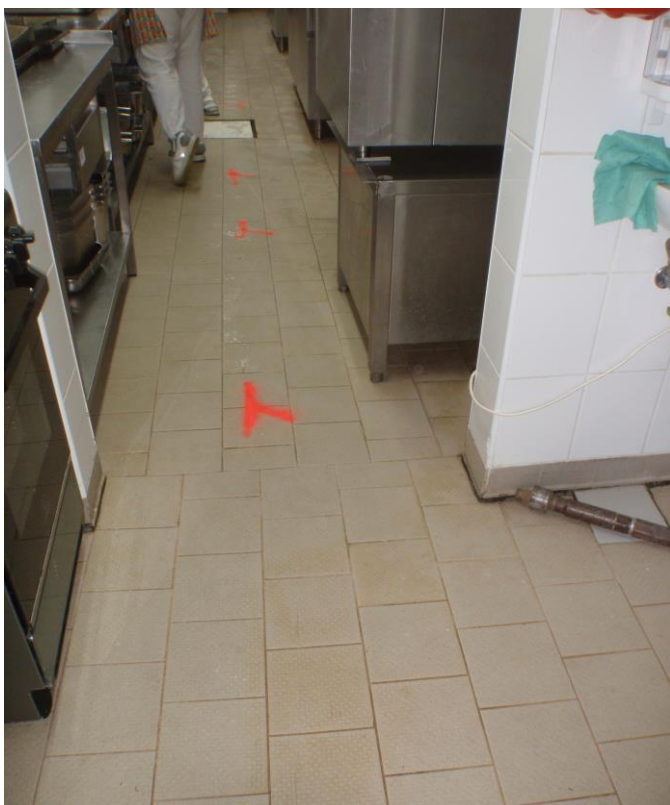
PODLAHOVÁ KONSTRUKCE KUCHYNĚ ( VARNY ) – TRASA KANALIZACE