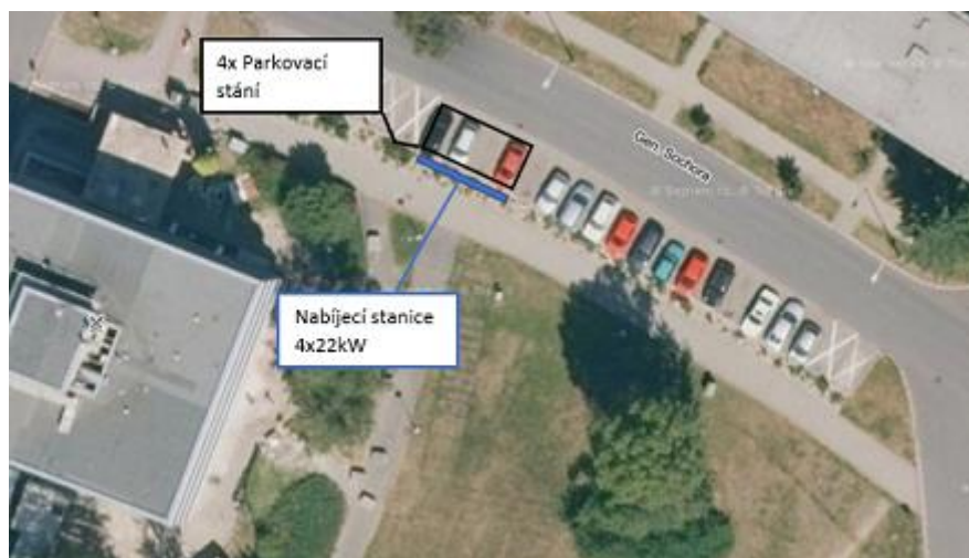
Obrázek č.5 - Fotografie umístění nabíjecí stanice včetně parkovacích míst

Čtyři nabíjecí stanice budou umístěny na stávajícím parkovišti u kancelářské budovy. Pro parkování i nabíjení se využijí stávající parkovací místa na parkovišti na ulici Gen. Sochora sousedící s krátkým zeleným pásem. Betonové základy pro nabíjecí stanice budou umístěny vždy na rozhraní dvou parkovacích míst v zeleném pásu. Jeden betonový základ bude určen pro jednu konzolu sloužící jako držák dvou nabíjecích stanic. Zákres umístění nabíjecích stanic včetně parkovacích míst je k vidění na Obrázku.