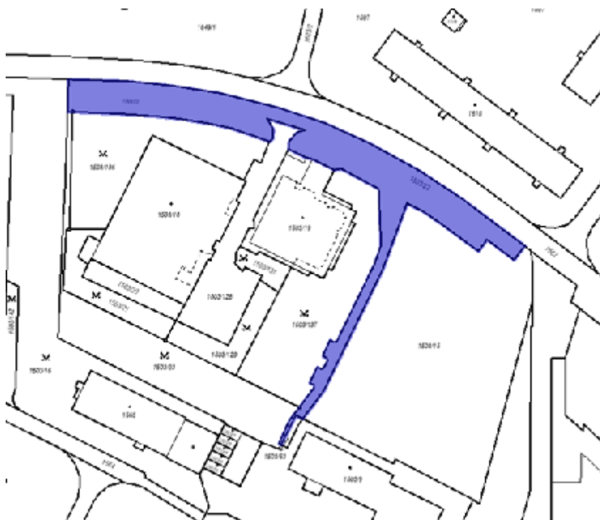
Obrázek č.4 - Katastrální mapa - parcela 1503/22