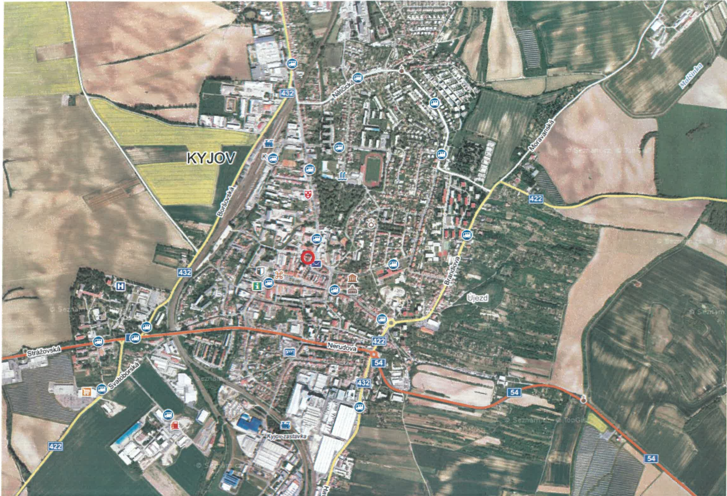
Umístění v rámci města