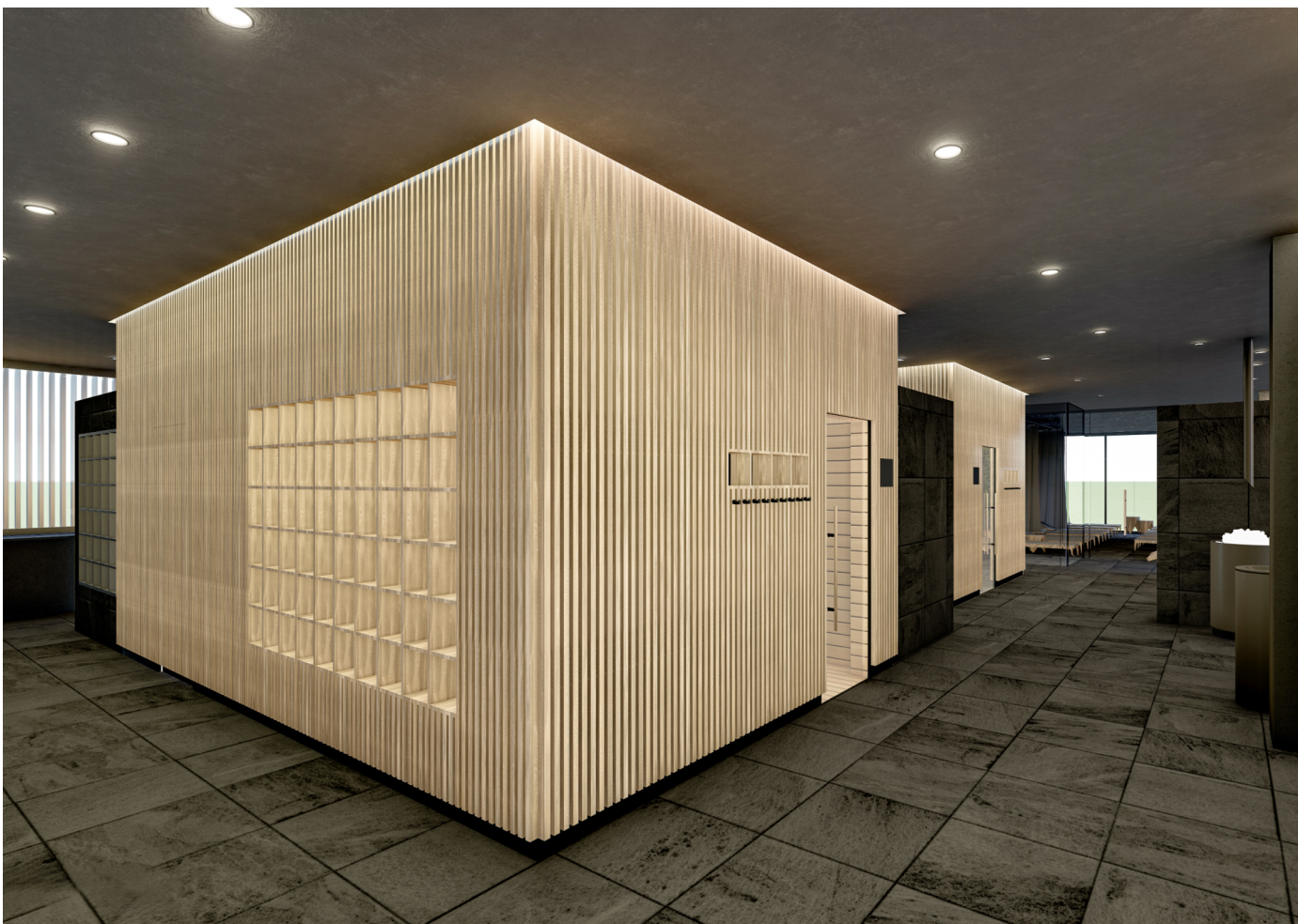
VIZUALIZACE MÍSTNOSTI 214