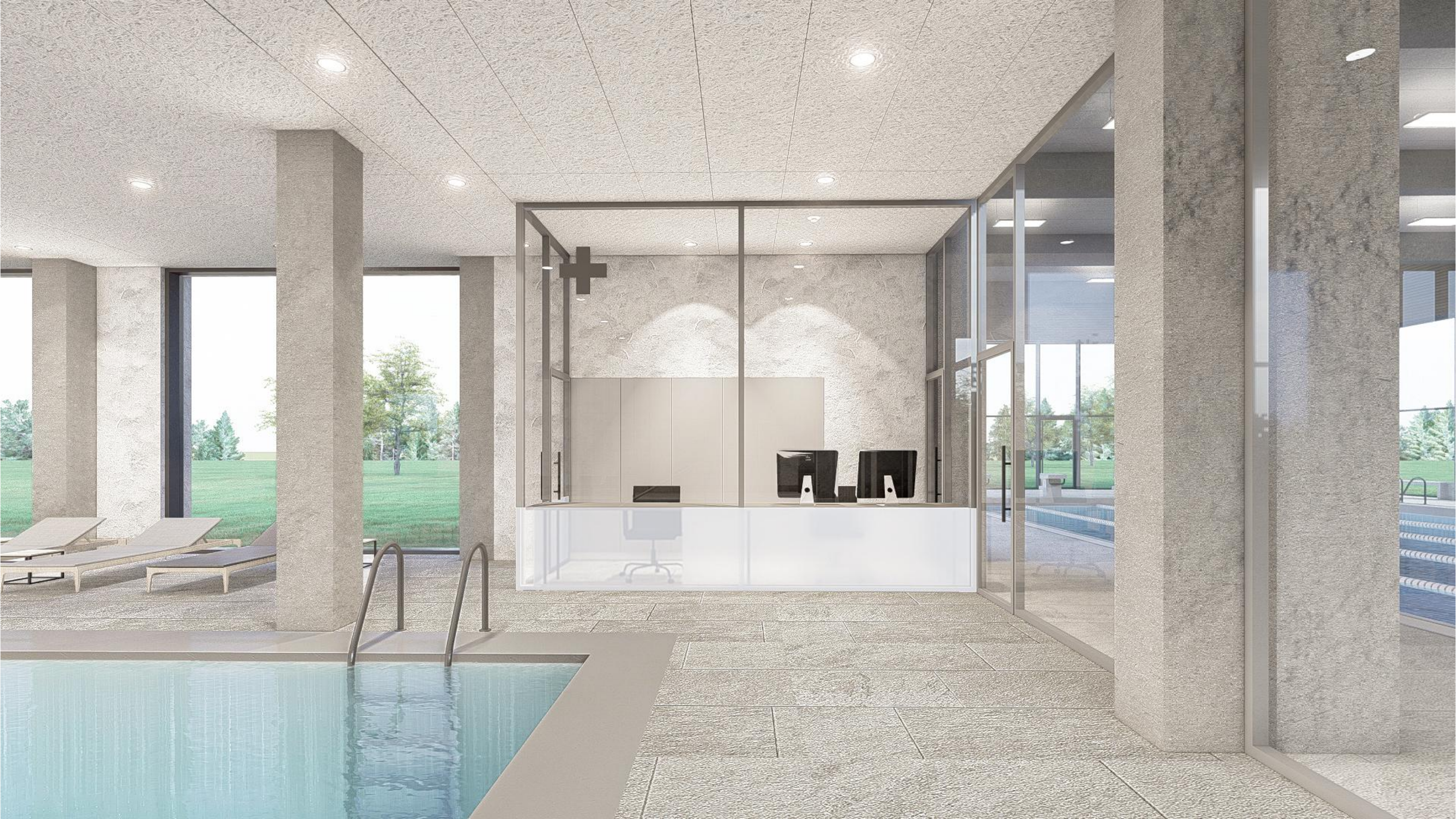
Pozn. 1: VIZUALIZACE JSOU POUZE ILUSTRATIVNÍ A MOHOU SE OD VÝKRESOVÉ DOKUMENTACE MÍRNĚ LIŠIT!