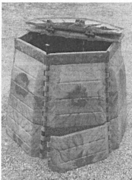
Foto: ilustrativní fotografie kompostéru