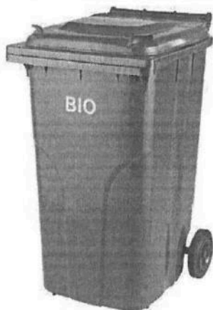
Foto: ilustrativní fotografie biopopelnice