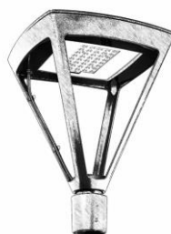
Příklad designu sadového svítidla:

Zadavatel požaduje z architektonických důvodů, aby sadové svítidlo vypadalo například takto.