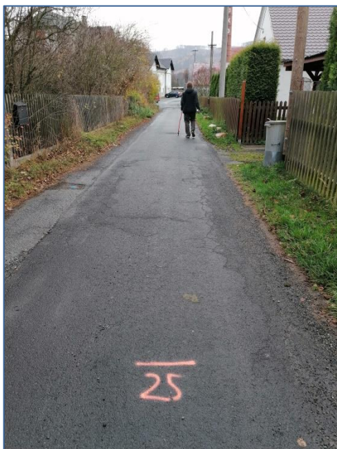
MK U muzea hraček 025m