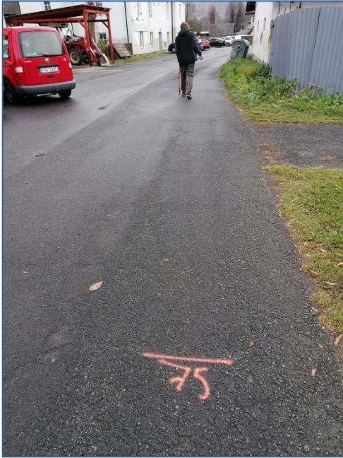
MK U muzea hraček ZÚ 075m