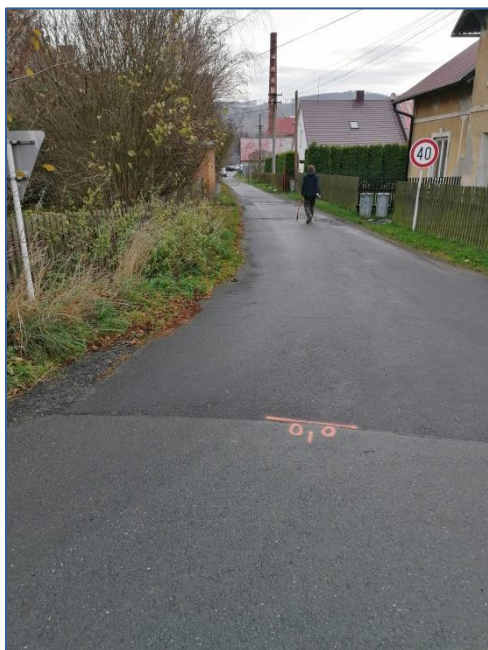
MK U muzea hraček ZÚ 000m