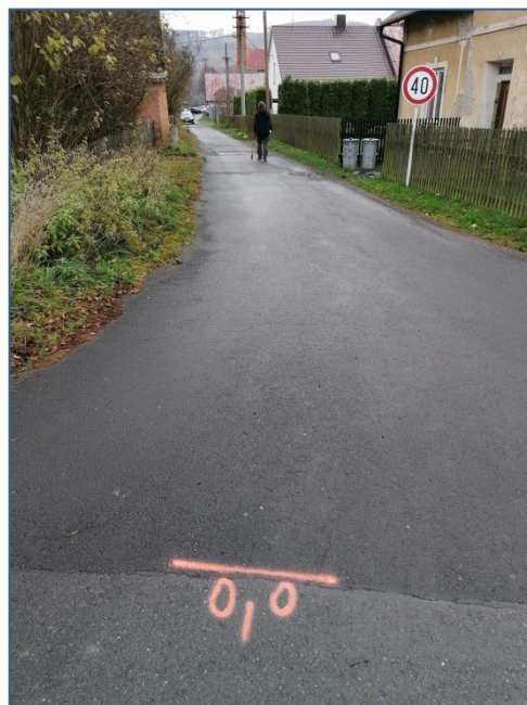
MK U muzea hraček 000m