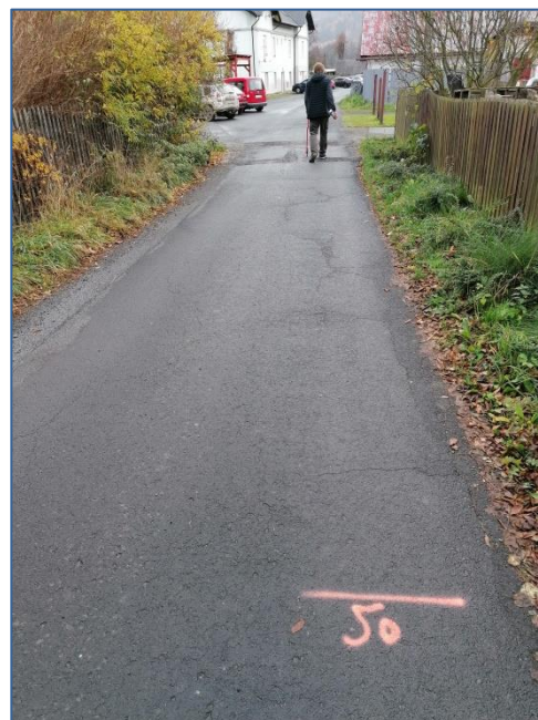
MK U muzea hraček 050m