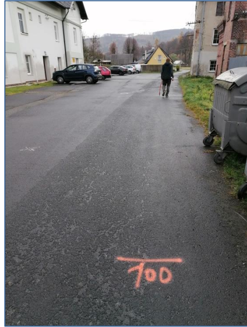
MK U muzea hraček 100m