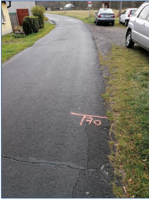
MK U muzea hraček KÚ 170m