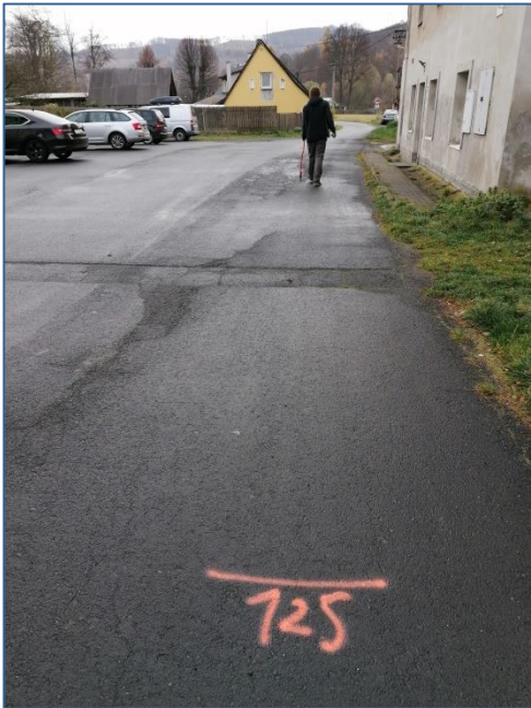
MK U muzea hraček 125m