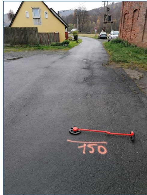
MK U muzea hraček 150m