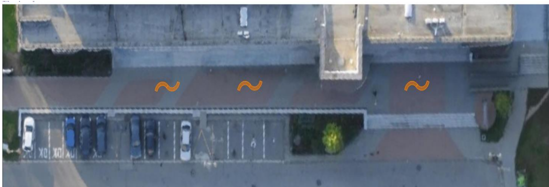
Obr. č. 5. navrhované umístění před KD Hodonín, zakreslené do ortofoto mapy