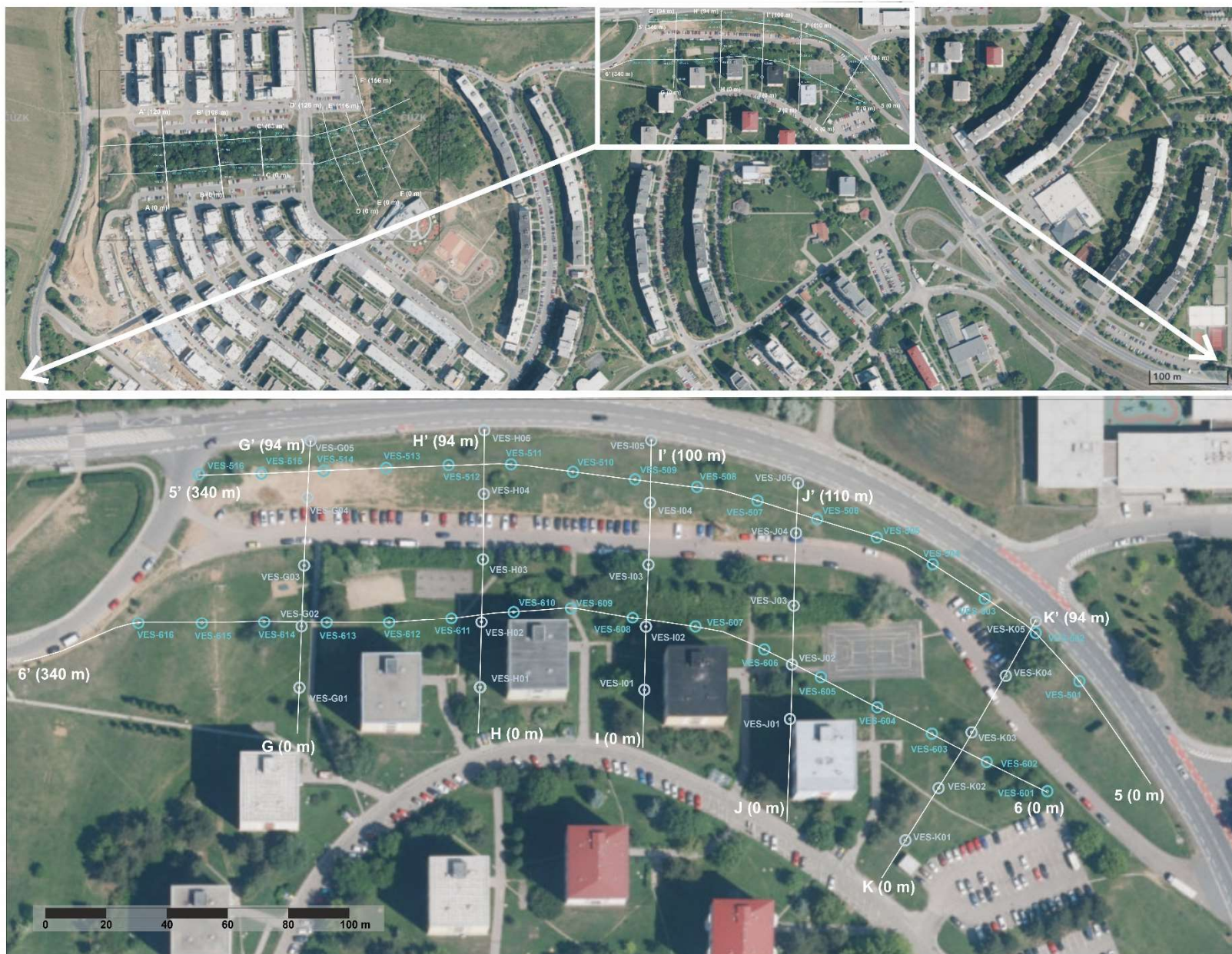
Obrázek 2: Situace geofyzikálních profilů na lokalitě Bystrc