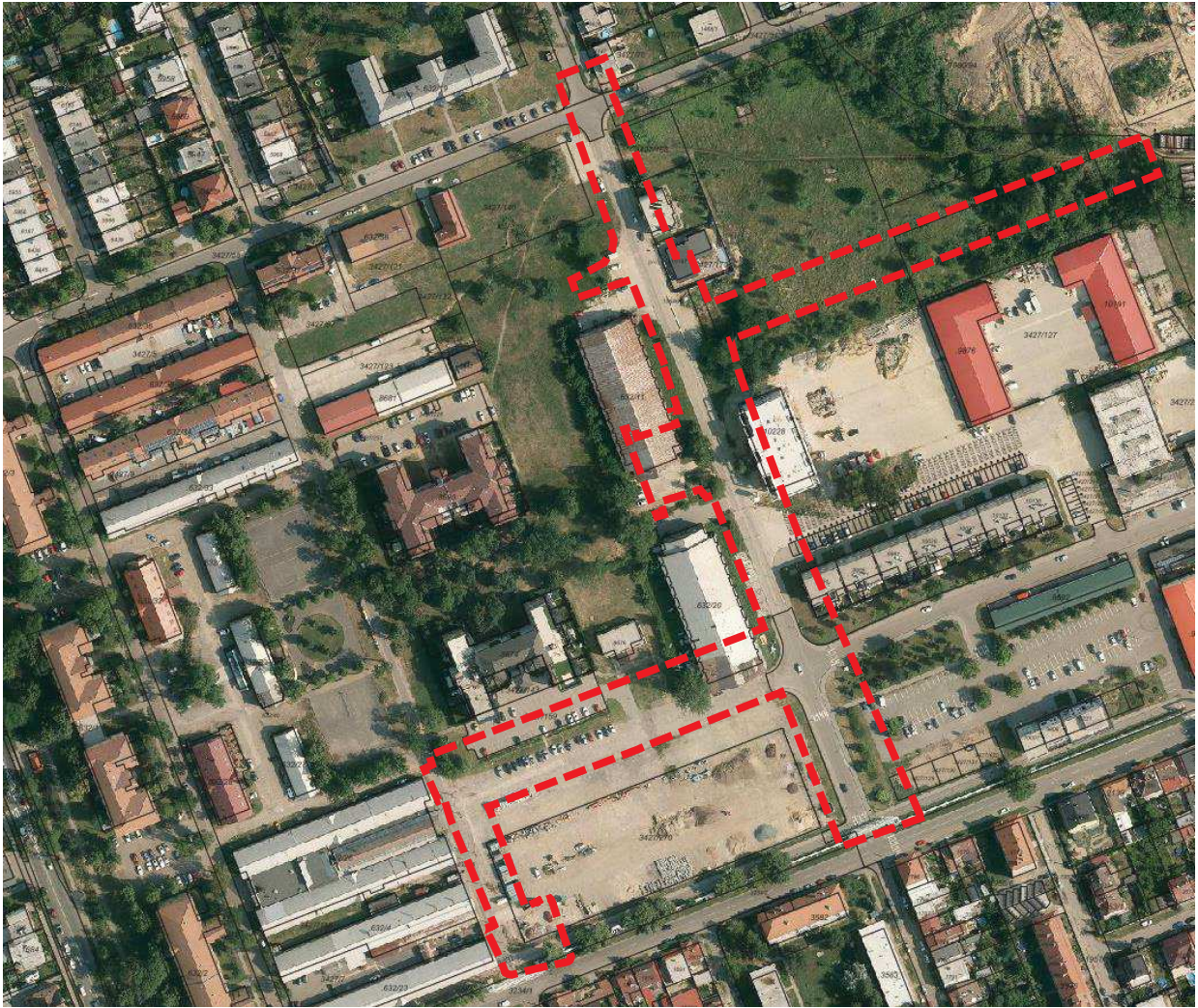
Zákres č. 2 – detail řešeného území návrhu stavby