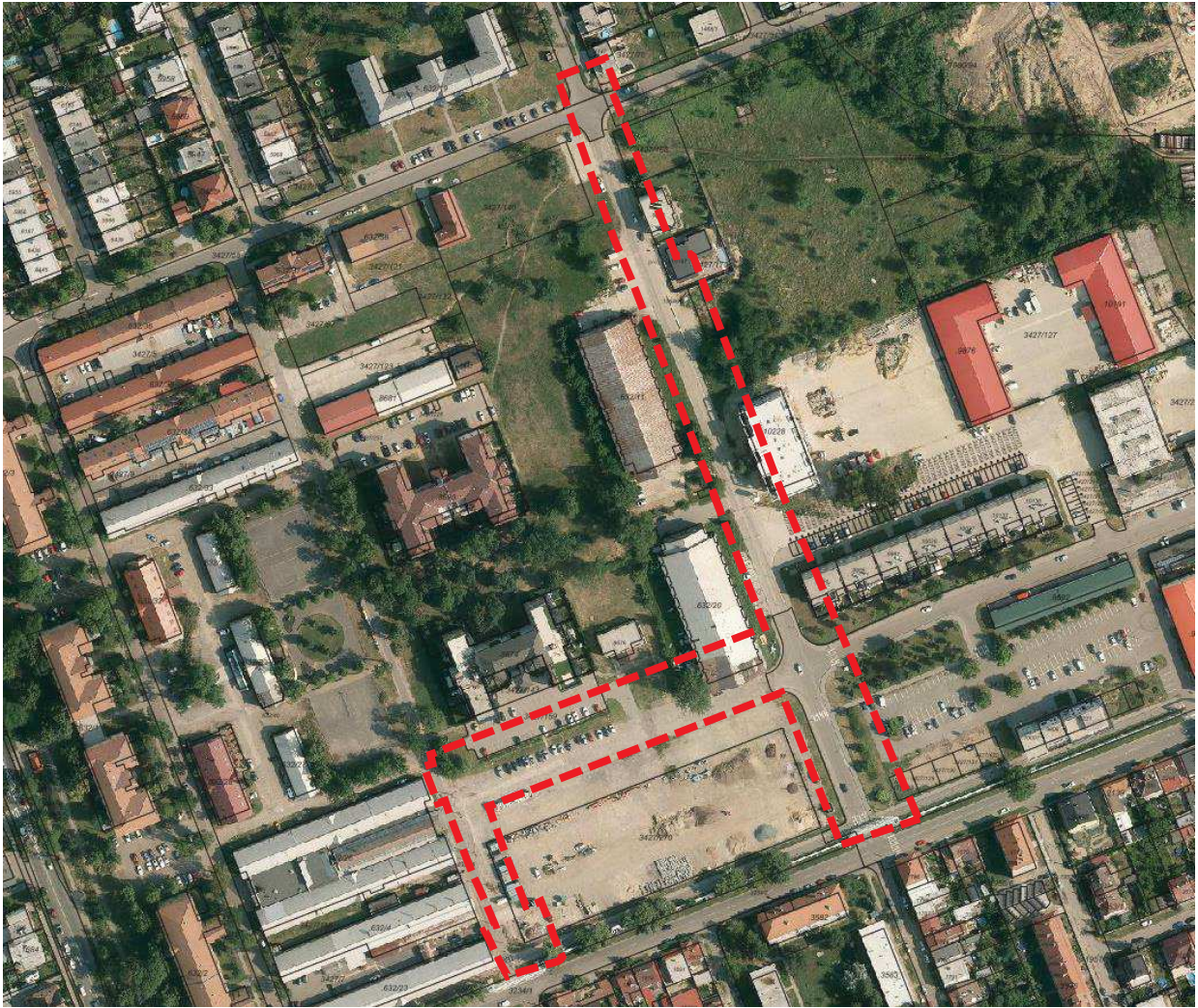
Zákres č. 3 – detail řešeného území PD pro povolení záměru