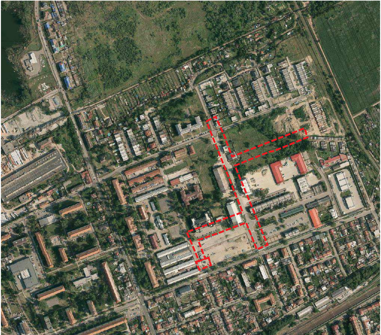
Zákres č. 1 – řešené území návrhu stavby