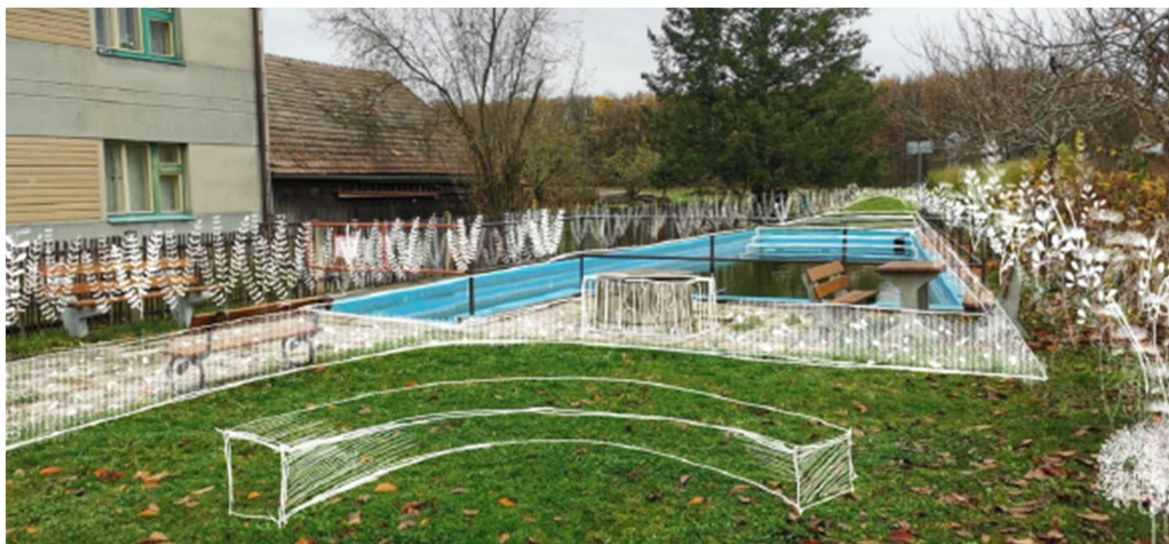
Obrázek 7 - Vizualizace návrhu