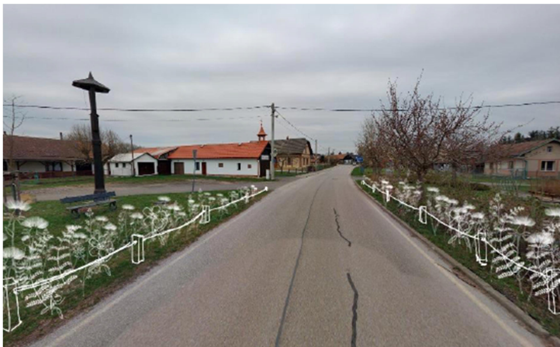
Obrázek 4 - Vizualizace návrhu

Součástí realizace bude jasné oddělení ploch zeleně a zpevněných ploch, rekonstrukce oplocení nádrže, všechny nové zpevněné plochy návsi budou tvořeny prvky umožňujícími vsakování dešťových vod. Pojezdové plochy jsou navrženy z pískovcových krajníků, prostor mezi krajníky bude vyplněn štěrkovým substrátem a zatravněn. Pochozí plochy jsou navrženy ze zatravňovací pískovcové dlažby z lomového kamene se širokou zatravněnou spárou.