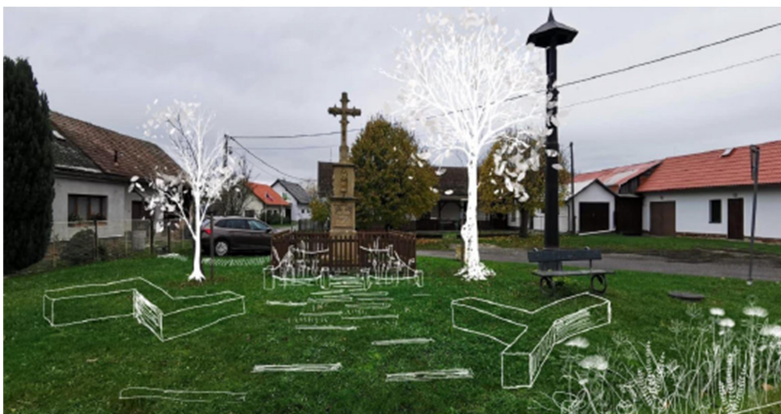
Obrázek 6 - Vizualizace návrhu

Náves bude doplněna novým mobiliářem. Předmětem projektu je rozšíření stávajícího (sedáky) a doplnění o nové prvky (stojany na kola, odpadkové koše). Cílem je typově sjednotit vzhled instalovaného mobiliáře a vybudovat v současnosti chybějící místa pro posezení, relaxaci a setkávání obyvatel a návštěvníků obce.