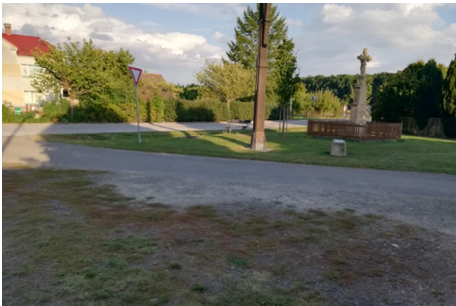
Obrázek 2 - Současný vzhled řešeného území

Cílem projektu je provést úpravy a doplnění stávající zeleně, vyměnit zastaralé prvky mobiliáře za nové a celkově revitalizovat, zpřístupnit a zatraktivnit řešené území, aby mohlo v mnohem větší míře sloužit občanům a návštěvníkům obce.