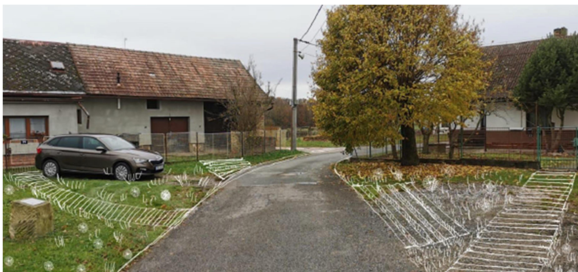
Obrázek 5 - Vizualizace návrhu

Součástí realizace bude jasné oddělení ploch zeleně a zpevněných ploch, rekonstrukce oplocení nádrže, všechny nové zpevněné plochy návsi budou tvořeny prvky umožňujícími vsakování dešťových vod. Pojezdové plochy jsou navrženy z pískovcových krajníků, prostor mezi krajníky bude vyplněn štěrkovým substrátem a zatravněn. Pochozí plochy jsou navrženy ze zatravňovací pískovcové dlažby z lomového kamene se širokou zatravněnou spárou.