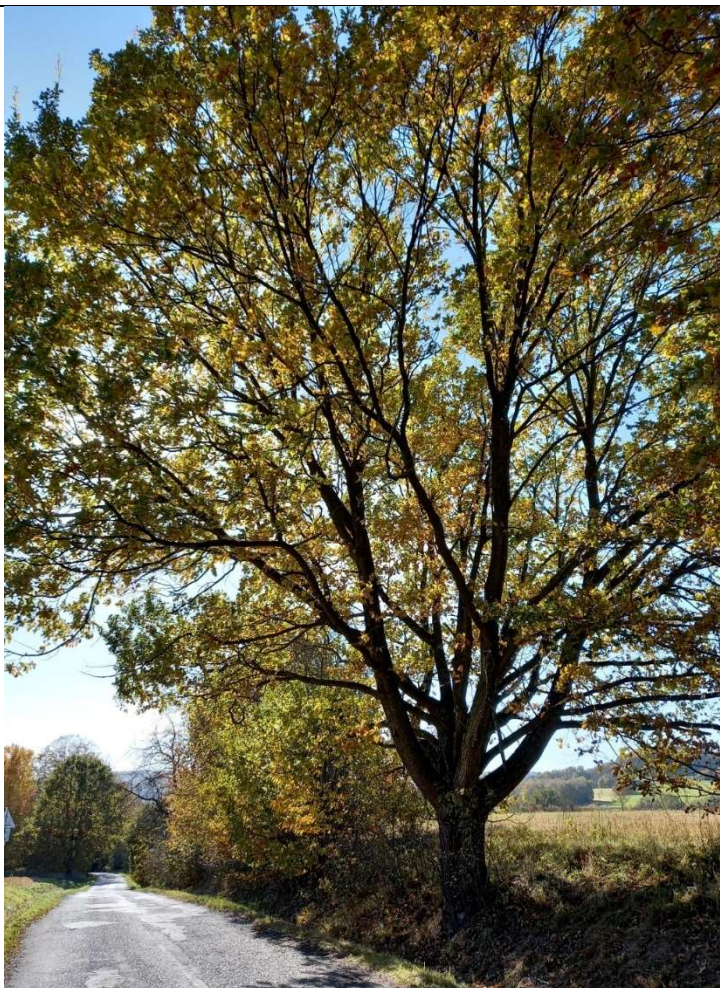
Obr. č. 10

Pohled na úsek určený pro novou výsadbu.