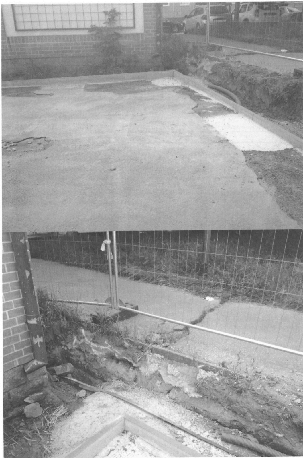
Příloha č. 4 ZL - Fotodokumentace - neukončený svod dešťové vody z budky správce