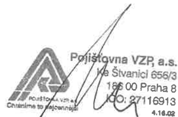
Razítko a podpis zástupce pojistitele